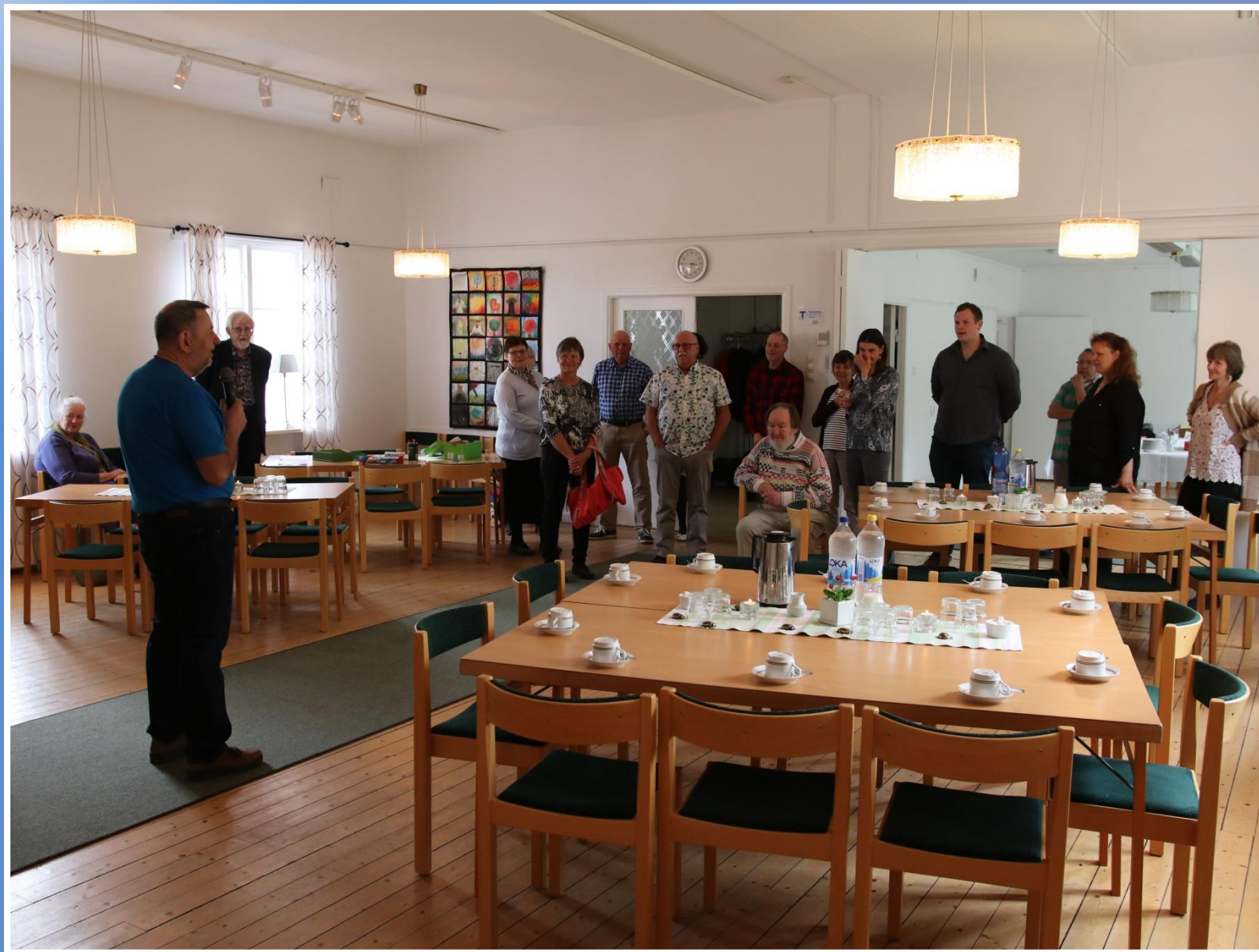
Jubilarn hälsar på sina gäster och inleder kaffebordet.