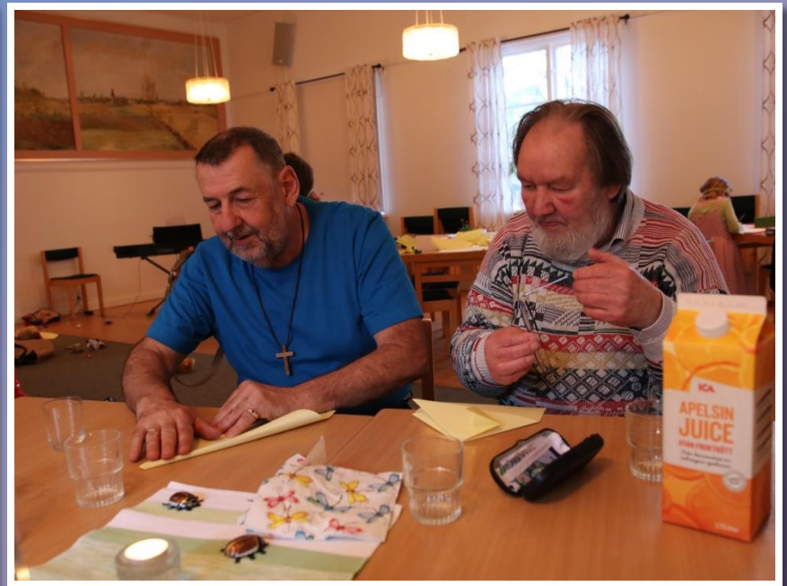
Åldret skyddar inte för någonting!