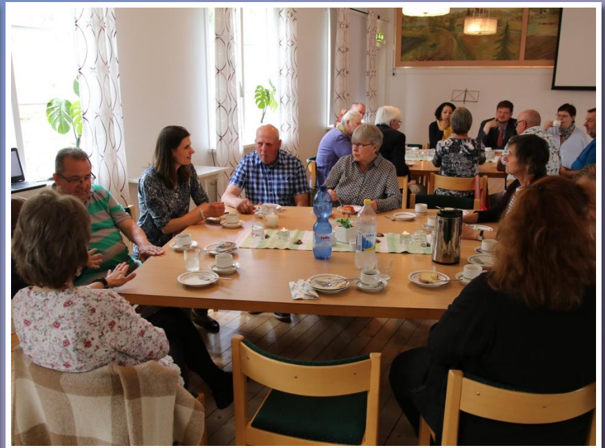
och ingen vill ge upp.