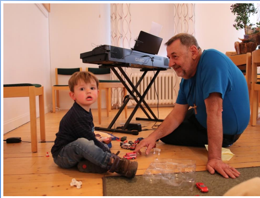
Han vill bara leka...