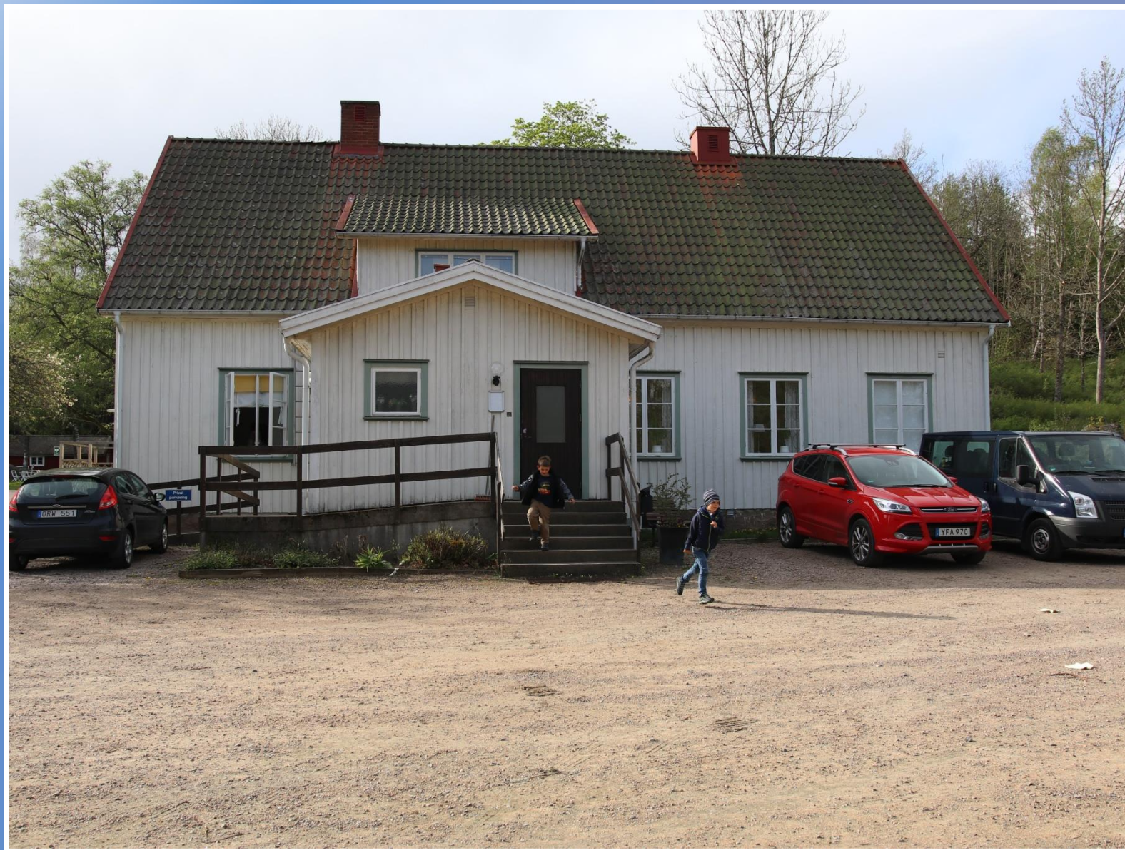
Kalaset äger rum i Ods Sockengården.