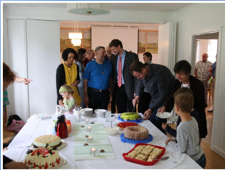
Alla kämpar i kalorierstrid